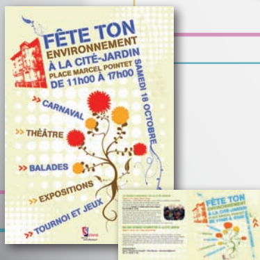
Affiche + dépliant 2 volets - 210 x 210 mm fermé