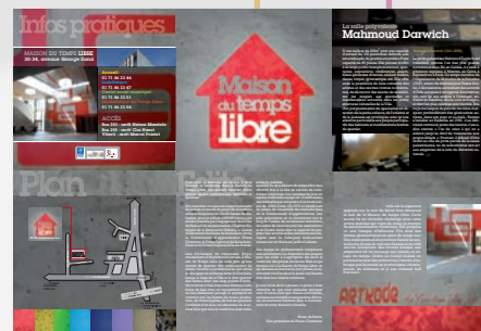
Dépliants 3 volets - 100 x 210 mm fermé