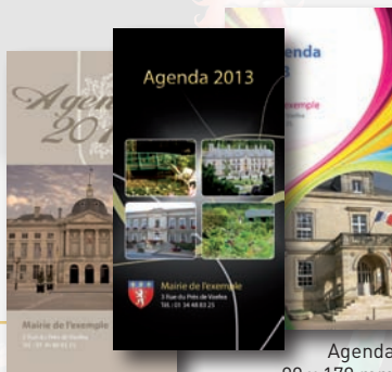
Agenda 90 x 170 mm